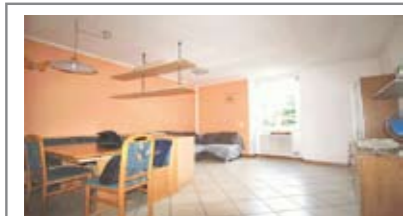
A008: PORT'AQUILA: MINIAPPARTAMENTO 54 mq. RISTRUTTURATO in palazzo storico totalmente ristrutturato nel 2000, a piano alto, ampio soggiorno-pranzo, cucinotto, disbrigo, stanza, bagno, totalmente arredato, T.A., Cl. En. D