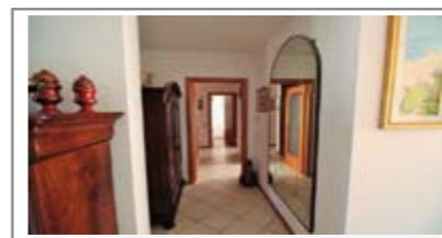
C069: MARTIGNANO: SPLENDOLO APPARTAMENTO RISTRUTTURATO ULTIMO PIANO, luminoso e soleggiato con splendida vista. Ingr., soggiorno con terrazzo a ovest, cucina con sala da pranzo, disbr., 2 stanze doppie, 2 bagni f., stanza matrimoniale, 2 cantine, garage, T.A., Cl. En. D