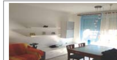
B392: ZONA CASTELLER: AMPIO APPARTAMENTO DUE STANZE CON TERRAZZE, ingr., soggiorno con terrazza 12 mq., cucina abitabile, disbrigo, 2 bagni, camera media, camera matrimoniale terrazza da 14 mq., ampia cantina, garage, T.A., Cl. En. C