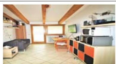
A019: RONCAFORT: MINI AD ULTIMO PIANO come nuovo, in palazzina di recente, ingresso, soggiorno cucina con ampio balcone a ovest, disbrigo arredabile, stanza matrimoniale, bagno f., garage, p.auto cond., T.A., Cl. En. C