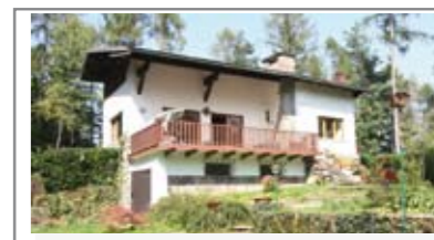
G027: TENNA: VILLA SINGOLA con 1000 mq. di giardino recintato, accesso da terrazza di oltre 30 mq. a sud, ampio soggiorno, cucina, balcone, bagno f., 2 stanze; in mansarda: bagno f., 2 stanze e ampia zona living. Box e Stube, T.A., Cl. En. E