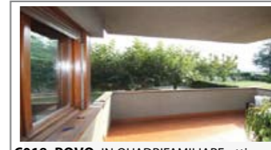
C018: POVO: IN QUADRIFAMILIARE ottimo appartamento di ben 107 mq. utili, ottimamente esposto e con vista. Ingr. soggiorno di 30 mq., terrazza, cucina abitabile, ripost., doppi servizi, disimp. arredabile, matrimoniale 18 mq., balcone, stanza doppia, (ricavabile terza stanza); box, cantina, orto e giardino, T.A., Cl. En. E