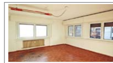
L007: V. GRAZIOLI: Luminoso UFFICIO/APPARTAMENTO 130 mq., in zona servitissima, a due passi dal centro e dal tribunale, a 1mo piano, ampio ingr. arredabile, soggiorno con ampio balcone, cucina, stanza doppia, stanza matrimoniale, stanza media, bagno f., cantina. (Attualmente A/10 trasformabile in A/2), Cl. En. D