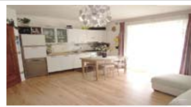
A077: MATTARELLO: RECENTE MINIAPPARTAMENTO con GIARDINO, in zona servita e centrale, ingresso, soggiorno con zona cottura e uscita sul terrazzo/giardino, disbrigo, stanza matrimoniale, bagno, garage, T.A., Cl. En. C