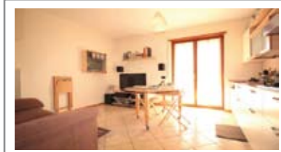
A061: VILLAMONTAGNA: MINIAPPARTAMENTO con Terrazzo, in piccola e recente palazzina, luminosissimo, ingresso, soggiorno/cucina, terrazza, corridoio, bagno, camera matrimoniale, giardinetto e cantina, T.A., Cl. En. D