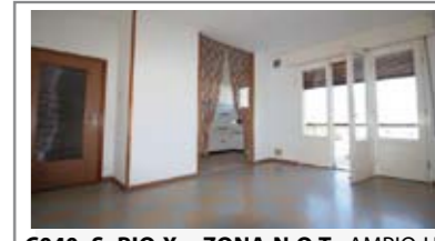
C040: S. PIO X - ZONA N.O.T.: AMPIO ULTIMO ED INTERO PIANO ampia soluzione, ingresso arredabile, sala giorno con balcone, sala pranzo con atro balcone, cucinino con dispensa, stanza bagno, 3 matrimoniali, p.auto in cortile privato, cantina e garage., Cl. En. D