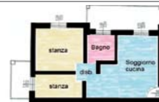
B039: MATTARELLO: RECENTISSIMO E ARREDATO vicino a tutti i principali servizi, luminoso appartamento composto da ingresso, soggiorno/cottura con terrazza abitabile, disbrigo, stanza matrimoniale, stanza singola, bagno f., secondo balcone, p.auto cond., T.A., Cl. En. N.D.