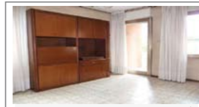
C057: RAVINA: AMPIO 3 STANZE in palazzina di 2 piani, ampia soluzione: ingresso, cucina abitabile, soggiorno, balcone, ripostiglio, bagno finestrato, due matrimoniali e una doppia. Cantina, soffitta e p. auto privato, T.A., Cl. En. E