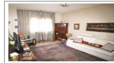
C061: ZONA S. CAMILLO: SIGNORILE 3 STANZE A PIANO ALTO a due passi dal centro, ampia metratura, luminoso e ben esposto, ingresso, soggiorno, balcone a sud, cucina abitabile, disbrigo, tre stanze matrimoniali, bagno f., ripostiglio, cantina., Cl. En. E