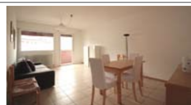
B028: CRISTO RE: ULTIMO PIANO CON ASCENSORE - RISTRUTTURATO, luminoso e panoramico, ingresso, cucinino e ampia zona soggiorno/pranzo con ampio balcone a SUD, disbrigo notte arredabile, ripost., bagno, 2 ampie matrimoniali, soffitta, p. auto privato, Cl. En. D