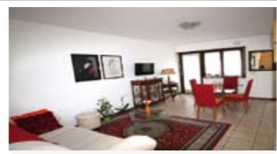
A080: LIMITROFO "ALBERA": MINIAPPARTAMENTO pari al NUOVO, zona servitissima, ingresso, soggiorno - cucina con uscita su balcone, bagno, camera matrimoniale con uscita su secondo balcone, cantina, Cl. En. C