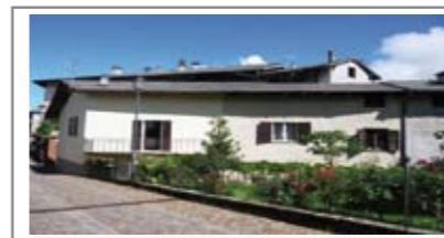
H010: VATTARO: BELLA PORZIONE LIBERA SU 3 LATI, in centro paese, da sistemare con possibilità di sopraelevazione e trasformazione in splendido DUPLEX con soggiorno, cucina abitabile, balcone a sud, bagno f., stanza, ripostiglio e sottotetto trasformabile in zona notte, avvolti, garage, T.A., Cl. En. G