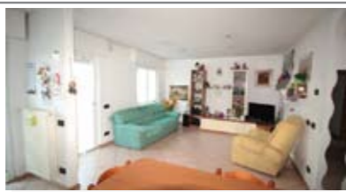
B001: S. PIO X: AMPIO 2 STANZE AD ULTIMO PIANO, ben esposto e luminoso, in piccola palazzina, recentemente ristrutturato, ingresso, soggiorno/cucina con balcone a ovest, disbrigo notte, ripostiglio, stanza matrimoniale, stanza doppia, secondo balcone, bagno f., cantina, soffitta, p. auto cond., T.A., Cl. En. E