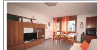
B070: CRISTO RE: OCCASIONE RIAMMODERNATO fuori dal traffico, vicino ai servizi, a piano rialzato, ben esposto, ampio ingresso, grande soggiorno - pranzo, comodo angolo cucina, ripostiglio, disimpegno notte, bagno f., 2 matrimoniali, cantina, p.auto cond. garantito, Cl. En. E