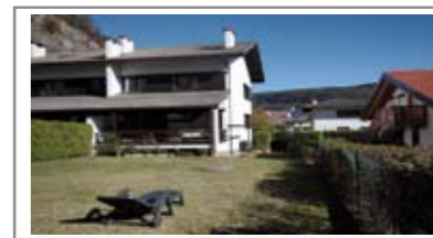
H035: CADINE: PORZIONE BIFAMILIARE CON 400 mq. GIARDINO in posizione dominante, ottimamente esposta, ampio soggiorno con terrazza a sud con accesso al favoloso giardino, cucina abitabile, doppi servizi, zona notte con ampia matrimoniale, stanza doppia e ampia singola. Open-space mansardato con w.c., cantina, lavanderia, garage, Cl. En. N.D.