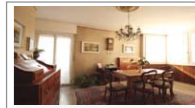
C065: ZONA V. MILANO: CENTRALISSIMO e SIGNORILE 3 STANZE: grande appartamento in condominio interamente manutentato, ingresso, cucina abitabile, ampio e luminoso soggiorno con balcone a sud/ovest; disbrigo notte, 2 grandi matrimoniali, bagno f., ripostiglio, cantina., Cl. En. E