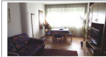
A133: TRENTO NORD: vicino a tutti i servizi, grazioso miniappartamento in recente palazzina. Ingresso arredabile, soggiorno/cucina, bagno, ampia matrimoniale, balcone, p. auto coperto privato, T.A., Cl. En. D