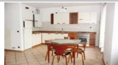
B012: SOPRAMONTE: ABITABILISSIMO, in piccola e recente palazzina, ottimo appartamento composto da ingresso, soggiorno-cucina, terrazzino ad ovest con vista libera, disbrigo, stanza matrimoniale, stanza singola, bagno, p.auto cond., T.A., Cl. En. E