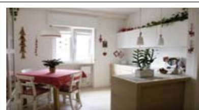
A023: VIA PERINI: SPLENDOLO MINIAPPARTAMENTO ULTIMO PIANO. In piccola palazzina, completamente ristrutturato e arredato a nuovo, zona soggiorno con cucina a vista, terrazza, ampia camera matrimoniale, disbrigo, ampio bagno f., soffitta, Cl. En. C+