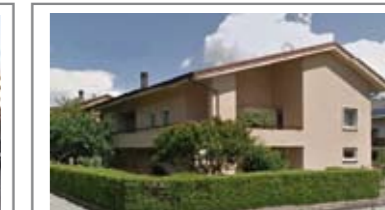
G061 PERGINE: VILLA SIGNORILE IN ZONA DI PREGIO ottimamente esposta con splendida vista libera, 500 mq. di giardino, 3 livelli fuori terra, possibilità di 2 ampi appartamenti indipendenti con ampi spazi accessori, abitabile da subito, sempre mantenuta, pannelli solari e voltaici, garage doppio, T.A., Cl. En. D