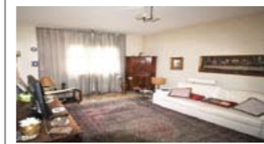
C061: ZONA S. CAMILLO: SIGNORILE 3 STANZE A PIANO ALTO a due passi dal centro, ampia metratura, luminoso e ben esposto, ingresso, soggiorno, balcone a sud, cucina abitabile, disbrigo, tre stanze matrimoniali, bagno f., ripostiglio, cantina, Cl. En. E