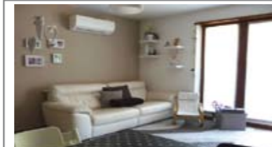
B015: MEANO: RECENTISSIMO E CON OGNI COMFORT, in graziosa palazzina, soluzione bicamere praticamente pari al nuovo: soggiorno/cucina, balcone, disimpegno notte arredabile, stanza doppia, stanza matrimoniale e bagno f., p. auto di proprietà, T.A., Cl. En. B