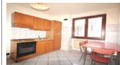
A064: SOPRAMONTE: MINIAPPARTAMENTO del 1996, in ottima palazzina, luminoso, ingresso, soggiorno/cucina, corridoio arredabile, ampio bagno f., camera matrimoniale, T.A., Cl. En. E