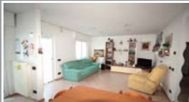
B001: S. PIO X: AMPIO 2 STANZE AD ULTIMO PIANO, ben esposto e luminoso, in piccola palazzina, recentemente ristrutturato, ingresso, soggiorno/cucina con balcone a ovest, disbrigo notte, ripostiglio, stanza matrimoniale, stanza doppia, secondo balcone, bagno f., cantina, soffitta, p. auto cond., T.A., Cl. En. E