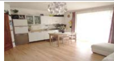
A077: MATTARELLO: RECENTE MINIAPPARTAMENTO con GIARDINO, in zona servita e centrale, ingresso, soggiorno con zona cottura e uscita sul terrazzo/giardino, disbrigo, stanza matrimoniale, bagno, T.A., Cl. En. C