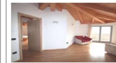
C074: VILLAMONTAGNA: ATTICO PANORAMICO PARI AL NUOVO, IN PICCOLA RECENTE PALAZZINA, completamente sbarriata, ingresso, ampia zona giorno, balconi panoramici, cucina abitabile, disbrigo notte, doppi servizi, tre stanze, garage doppio e cantina, T.A., Cl. En. B