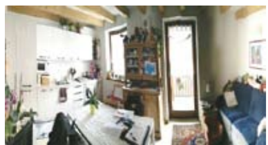
A001: CIVEZZANO: RECENTE RISTRUTTURAZIONE CLASSE "A" in palazzina di 3 unità, zona giorno con angolo cottura, ampio balcone ottimamente esposto, disbr. notte, matrimoniale, bagno f., cantina, p. auto privato. (risc. a pavimento, pannelli solari, come nuovo), T.A., Cl. En. A