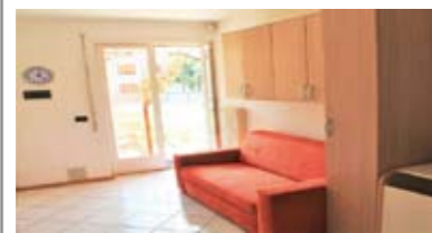
A007: BESENELLO: MINIAPPARTAMENTO del 2002 con GIARDINO 60 mq. a SUD in piccola palazzina, ottime condizioni, ingr., soggiorno-cucina, disbrigo, stanza matrimoniale, bagno, balcone, ripostiglio, garage 18 mq., imp. allarme, T.A., Cl. En. D