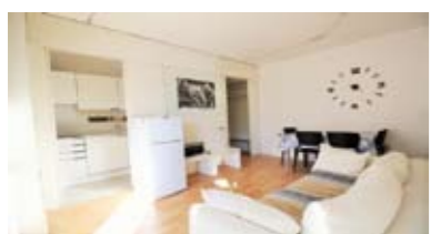
A031: CRISTO RE: OTTIMA SOLUZIONE PER INVESTIMENTO! Adiacente al centro, comodissimo alla stazione, appartamento riammodernato, totalmente arredato e ben esposto, ingresso, soggiorno con angolo cucina, stanza matrimoniale, bagno e terrazza da 50 mq., Cl. En. D