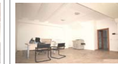
L005: ZONA PZZA DUOMO: Ufficio / Negozio a piano strada vetrinato, totalmente ristrutturato nel 2002, accesso da cortiletto all'interno di una corte condominiale, ampio openspace per la zona ufficio, antibagno e bagno, cantina. (cablato, non esposto direttamente sulla pubblica via), T.A., Cl. En. D