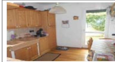
B056 VILLAZZANO: AMPIO DUE STANZE CON GIARDINO in piccolo contesto, ottime condizioni, ingresso nella zona giorno con cucina abitabile, bagno di servizio, disbrigo notte, bagno f., due stanze. Da tutti i locali si accede alla zona verde in parte piastrellata. Garage con annessa cantina. Cl. En. D