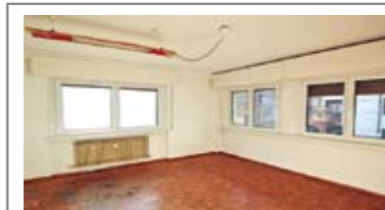
L007: V. GARIZOLI/S. CAMILLO: Luminoso UFFICIO/APPARTAMENTO 130 mq., in zona servitissima, a due passi dal centro e dal tribunale, a 1mo piano, ampio ingr. arredabile, soggiorno con ampio balcone, cucina, stanza doppia, stanza matrimoniale, stanza media, bagno f., cantina. (Attualmente A/10 trasformabile in A/2), Cl. En. D