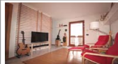
B043: V. VATTARO: IN RECENTE PICCOLA PALAZZINA, appartamento panoramico, ballatoio/balcone privato, ingresso, soggiorno/pranzo con balcone dalla splendida vista libera, cucinotto, disbrigo, 2 stanze da letto, secondo balcone, bagno f., cantina f., Cl. En. B