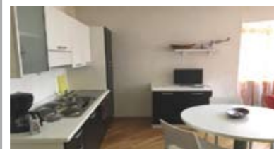
A056: LIMITROFO CENTRO STORICO: MINIAPPARTAMENTO A NUOVO e ARREDATO, in posizione strategica, secondo piano, ingresso, bagno con doccia, soggiorno/cucina e camera matrimoniale. Ottimo anche per investimento! Cl. En. C