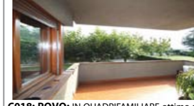
C018: POVO: IN QUADRIFAMILIARE ottimo appartamento di ben 107 mq. utili, ottimamente esposto e con vista. Ingr., soggiorno di 30 mq., terrazza, cucina abitabile, ripost., doppi servizi, disimp. arredabile, matrimoniale 18 mq., balcone, stanza doppia, (ricavabile terza stanza); box, cantina, orto e giardino, T.A., Cl. En. E