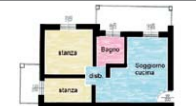
B039: MATTARELLO: RECENTISSIMO E ARREDATO vicino a tutti i principali servizi, luminoso appartamento composto da ingresso, soggiorno/cottura con terrazza abitabile, disbrigo, stanza matrimoniale, stanza singola, bagno f., secondo balcone, p. auto cond., T.A., Cl. En. N.D.