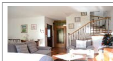
H020: COGNOLA: SCHIERA DI TESTA IMMERSA NEL VERDE in contesto esclusivo ed appartato, dagli ampi spazi interni, ottimamente mantenuta, cucina abitabile, ampio soggiorno, balcone abitabile, ampia scala, 3 stanze ed il secondo bagno f., soffitta, terrazza a vasca panoramica, box doppio, lavanderia. Pannelli solari, cappotto, imp. allarme. Cl. En. D