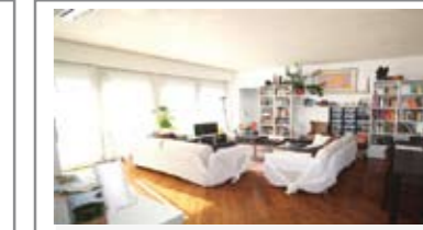
B099 ZONA V. GRAZIOLI: IMMOBILE DI PREGIO - ESCLUSIVO, piano alto, FINEMENTE RISTRUTTURATO, ampio ingr., soggiorno con cucina a vista, loggia panoramica, stanza/studio, doppi servizi, ripostiglio, camera matrimoniale con cabina armadio, soffitta, elegante arredo, Cl. En. E