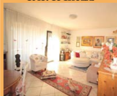
SECONDO E ULTIMO PIANO PANORAMICO - RISTR. 2005, vicino a tutti i servizi, luminosissimo, ingr. arredabile, rara zona giorno da oltre 40 mq., balconi panoramici, scala di dislivello, 2 matrimoniali, balcone, stanza singola, ripost., doppi servizi. Cantina e garage, T.A., Cl. En. E