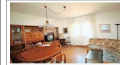
B065 CRISTO RE: A DUE PASSI DAL CENTRO, in un contesto tranquillo, ingresso, soggiorno, cucinotto con uscita sul balcone, disbrigo, bagno finestrato con vasca, stanza matrimoniale, stanza singola, ripostiglio, Cl. En. N.D.