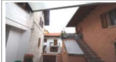
B052: VILLAMONTAGNA: PORZIONCINA INDIPENDENTE, in centro storico, a piano terra 2 ampi avvolti ad uso deposito/cantina con w.c., a primo piano, ballatoio, ingr., soggiorno con angolo cucina, 1° stanza, ampio bagno, disimpegno notte, 2 stanze letto e guardaroba. Possibilità di garage, Cl. En. N.D.