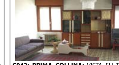
C043: PRIMA COLLINA: VISTA SU TUTTA LA CITTA', luminoso appartamento da 130 mq., ampio ingresso, soggiorno, grande terrazza panoramica, cucina abitabile, 3 stanze, doppi servizi, p. auto cond., ampia soffitta. Cl. En. E