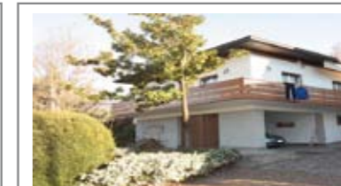
G006: CERNIDOR/BELLEVUE: VILLA SINGOLA IN POSIZIONE DOMINANTE, strutturata su 2 livelli fuori terra. Ingresso, cucina abitabile, enorme soggiorno, terrazzo con vista panoramica, 2 stanze matrimoniali, stanza singola, bagno f., giardino, garage, cantina, vano caldaia/lavanderia. A piano terra stanza/studio indipendente con bagno. Possibilità di soprizzo, T.A., Cl. En. E