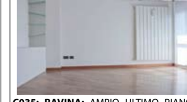
C035: RAVINA: AMPIO ULTIMO PIANO a SUD - SPLENDIDA VISTA, centralissimo, in contesto tranquillo e riservato, ingr., cucina abitabile, soggiorno, due balconi, disbr. notte, 3 ampie stanze, doppi servizi, comodo garage e cantina, T.A., Cl. En. E