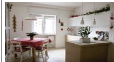
A023: VIA PERINI: SPLENDIDO MINIAPPARTAMENTO ULTIMO PIANO, in piccola palazzina, completamente ristrutturato e ammobiliato a nuovo, zona soggiorno con cucina a vista, terrazza, ampia camera matrimoniale, disbrigo, ampio bagno f., soffitta, Cl. En. C+