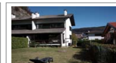
H035: CADINE: PORZIONE BIFAMILIARE CON 400 mq. GIARDINO in posizione dominante, ottimamente esposta, ampio soggiorno con terrazza a sud con accesso al favoloso giardino, cucina abitabile, doppi servizi, zona notte con ampia matrimoniale, stanza doppia e ampia stanza singola. Openspace mansardato con w.c., cantina, lavanderia, garage, Cl. En. N.D.