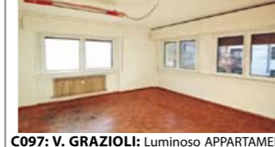
C097: V. GRAZIOLI: Luminoso APPARTAMENTO/UFFICIO 130 mq., in zona servitissima, a due passi dal centro e dal tribunale, a 1mo piano, ampio ingr. arredabile, soggiorno con ampio balcone, cucina, stanza doppia, stanza matrimoniale, stanza media, bagno f., cantina. (Attualmente A/10 trasformabile in A/2), Cl. En. D