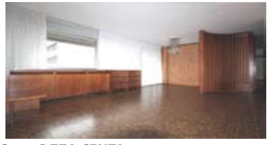
C112: PZZA CENTA: Luminoso appartamento 105 mq. utili, in condominio signorile, a piano alto, ingresso, soggiorno, balcone su due lati con accesso da tutti i locali, cucina abitabile, ripostiglio, disbrigo arredabile, stanza matrimoniale, stanza doppia, possibilità ricavo terza stanza, bagno, garage, Cl. En. C+