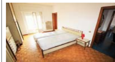
A075: ZONA UNIVERSITA': MINIAPPARTAMENTO a piano ALTO, in ottima palazzina servita da ascensore, ampia metratura, ingresso, soggiorno con cucinino a vista, ampia camera matrimoniale, bagno ristrutturato finestrato, balcone, soffitta, p. auto cond.. Ottimo investimento! Cl. En. D