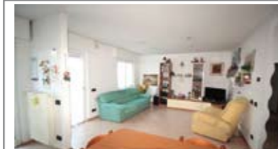
B001: S. PIO X: AMPIO 2 STANZE AD ULTIMO PIANO, ben esposto e luminoso, in piccola palazzina, recentemente ristrutturato, ingresso, soggiorno/cucina con balcone a ovest, disbrigo notte, ripostiglio, stanza matrimoniale, stanza doppia, secondo balcone, bagno f., cantina, soffitta, p. auto cond., T.A., Cl. En. E