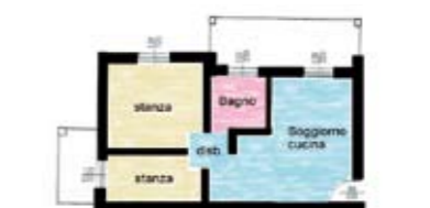
B039: MATTARELLO: RECENTISSIMO E ARREDATO vicino a tutti i principali servizi, luminoso appartamento composto da ingresso, soggiorno/cottura con terrazza abitabile, disbrigo, stanza matrimoniale, stanza singola, bagno f., secondo balcone, p.auto cond., T.A., Cl. En. N.D.