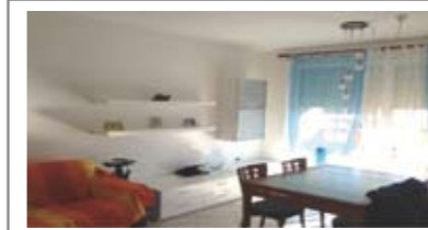
B392: ZONA CASTELLER: AMPIO APPARTAMENTO DUE STANZE CON TERRAZZE, ingr., soggiorno con terrazza 12 mq., cucina abitabile, disbrigo, 2 bagni, camera media, camera matrimoniale terrazza da 14 mq., ampia cantina, garage, T.A., Cl. En. C