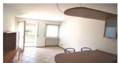
A027: CANOVA: BEL MINIAPPARTAMENTO A fuori dal traffico, IN ESCLUSIVA, ingresso, soggiorno/cucina con uscita sull'ampio balcone, stanza matrimoniale, bagno f., cantina, Cl. En. D