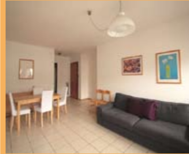
B032: CENTRO STORICO: CON SPENDIDO AFFACCIO, IN ESCLUSIVA, bell'appartamento di ampia metratura, ingresso, ampio soggiorno, cucina abitabile, balcone, disbrigo, stanza matrimoniale, 2 stanze singole, bagno. Ottimo investimento! Cl. En. N.D.