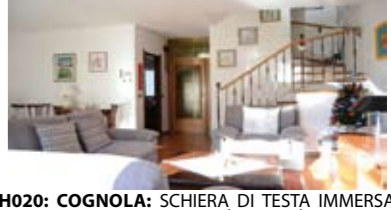
H020: COGNOLA: SCHIERA DI TESTA IMMERSA NEL VERDE in contesto esclusivo ed appartato, dagli ampi spazi interni, ottimamente mantenuta, cucina abitabile, ampio soggiorno, balcone abitabile, ampia scala, 3 stanze ed il secondo bagno f., soffitta, terrazza a vasca panoramica, box doppi, lavanderia. Pannelli solari, cappotto, imp. allarme. Cl. En. D