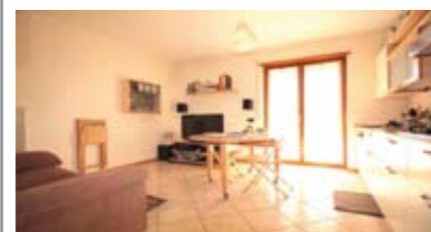
A061: VILLAMONTAGNA: MINIAPPARTAMENTO con Terrazzo, in piccola e recente palazzina, luminosissimo, ingresso, soggiorno/cucina, terrazza, corridoio, bagno, camera matrimoniale, giardinetto