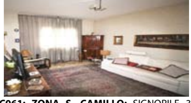
C061: ZONA S. CAMILLO: SIGNORILE 3 STANZE A PIANO ALTO a due passi dal centro, ampia metratura, luminoso e ben esposto, ingresso, soggiorno, balcone a sud, cucina abitabile, disbrigo, tre stanze matrimoniali, bagno f., ripostiglio, cantina, Cl. En. E