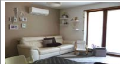
B015: MEANO: RECENTISSIMO E CON OGNI COMFORT, In graziosa palazzina, soluzione bicamera praticamente pari al nuovo: soggiorno/cucina, balcone, disimpegno notte arredabile, stanza doppia, stanza matrimoniale e bagno f., p. auto di proprietà, T.A., Cl. En. B