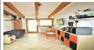
A019: RONCAFORT: MINI AD ULTIMO PIANO come nuovo, in palazzina di recente, ingresso, soggiorno cucina con ampio balcone a ovest, disbrigo arredabile, stanza matrimoniale, bagno f., garage, p.auto cond., T.A., Cl. En. C