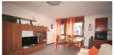
B070: CRISTO RE: OCCASIONE RIAMMODERNATO fuori dal traffico, vicino ai servizi, a piano rialzato, ben esposto, ampio ingresso, grande soggiorno - pranzo, comodo angolo cucina, ripostiglio, disimpegno notte, bagno f., 2 matrimoniali, cantina, p.auto cond. garantito, Cl. En. E