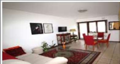
A080: LIMITROFO "ALBERE": MINIAPPARTAMENTO pari al NUOVO, zona servitissima, ingresso, soggiorno - cucina con uscita su balcone, bagno, camera matrimoniale con uscita su secondo balcone, cantina, Cl. En. C