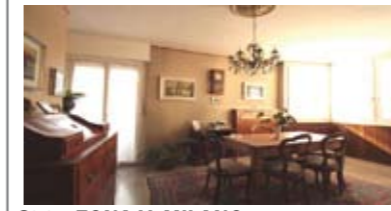
C065: ZONA V. MILANO: CENTRALISSIMO e SIGNORILE 3 STANZE: grande appartamento in condominio interamente manutentato, ingresso, cucina abitabile, ampio e luminoso soggiorno con balcone a sud/ovest; disbrigo notte, 2 grandi matrimoniali, balcone, stanza doppia, doppi servizi, ripostiglio, Cl. En. E