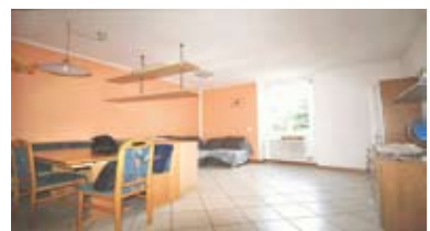
A008: PORT'AQUILA: MINIAPPARTAMENTO 54 mq. RISTRUTTURATO in palazzo storico totalmente ristrutturato nel 2000, a piano alto, ampio soggiorno-pranzo, cucinotto, disbrigo, stanza, bagno, totalmente arredato, T.A., Cl. En. D