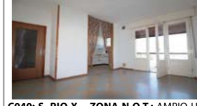
C040: S. PIO X - ZONA N.O.T.: AMPIO ULTIMO ED INTERO PIANO ampia soluzione, ingresso arredabile, sala giorno con balcone, sala pranzo con atro balcone, cucinino con dispensa, stanza bagno, 3 matrimoniali, p.auto in cortile privato, cantina e garage., Cl. En. D