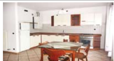
B012: SOPRAMONTE: ABITABILISSIMO, in piccola e recente palazzina, ottimo appartamento composto da ingresso, soggiorno-cucina, terrazzino ad ovest con vista libera, disbrigo, stanza matrimoniale, stanza singola, bagno, p.auto cond., T.A., Cl. En. E