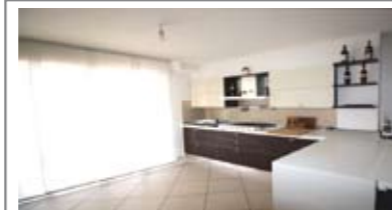
B016: PISCINE GARDOLO: RECENTEMENTE RISTRUTTURATO, secondo piano, in piccola palazzina, ampio ingresso, cucina - soggiorno, balcone, 2 ampie camere da letto, secondo balcone, bagno f., ripostiglio/lavanderia, garage, p.auto cond., T.A., Cl. En. E