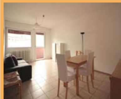
ULTIMO PIANO CON ASCENSORE RISTRUTTURATO, luminoso e panoramico, ingresso, cucinino e ampia zona soggiorno/pranzo con ampio balcone a SUD, disbrigo notte arredabile, ripost., bagno, 2 ampie matrimoniali, soffitta, p. auto privato, Cl. En. D