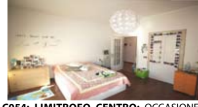
C054: LIMITROFO CENTRO: OCCASIONE, ampia soluzione tricamere da 133 mq., abitabile da subito: ingr., corridoio, grande soggiorno/cucina, 3 ampie matrimoniali, 2 bagni f., cantina e due posti auto in cortile privato, T.A., Cl. En. E