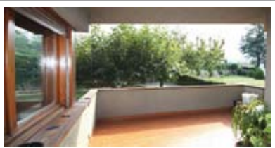
C018: POVO: IN QUADRIFAMILIARE ottimo appartamento di ben 107 mq. utili, ottimamente esposto e con vista. Ingr., soggiorno di 30 mq., terrazza, cucina abitabile, ripost., doppi servizi, disimp. arredabile, matrimoniale 18 mq., balcone, stanza doppia, (ricavabile terza stanza); box, cantina, orto e giardino, T.A., Cl. En. E