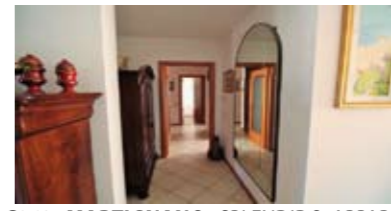
C069: MARTIGNANO: SPENDIDO APPARTAMENTO RISTRUTTURATO ULTIMO PIANO, luminoso e soleggiato con splendida vista. Ingr., soggiorno con terrazzo a ovest, cucina con sala da pranzo, disbr., 2 stanze doppie, 2 bagni f., stanza matrimoniale, 2 cantine, garage, T.A., Cl. En. D