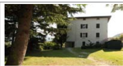
H005: TERLAGO: PORZIONE TERRA-CIELO, oltre 300 mq su tre livelli, da sistemare, parco verde esterno con vialetto di accesso; ideale per ricavarne soluzione bi/tri-familiare, Cl. En. F