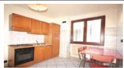
A064: SOPRAMONTE: MINIAPPARTAMENTO del 1996, in ottima palazzina, luminoso, ingresso, soggiorno/cucina, corridoio arredabile, ampio bagno f., camera matrimoniale, T.A., Cl. En. E