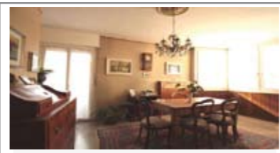
C065: ZONA V. MILANO: CENTRALISSIMO e SIGNORILE 3 STANZE: grande appartamento in condominio interamente manutentato, ingresso, cucina abitabile, ampio e luminoso soggiorno con balcone a sud/ovest; disbrigo notte, 2 grandi matrimoniali, balcone, stanza doppia, doppi servizi, ripostiglio, Cl. En. E