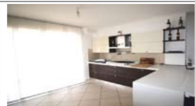
B016: PISCINE GARDOLO: RECENTEMENTE RISTRUTTURATO, secondo piano, in piccola palazzina, ampio ingresso, cucina - soggiorno, balcone, 2 ampie camere da letto, secondo balcone, bagno f., ripostiglio/lavanderia, garage, p. auto cond., T.A., Cl. En. E