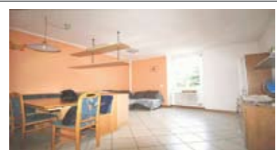
A008: PORT' AQUILA: MINIAPPARTAMENTO 54 mq. RISTRUTTURATO in palazzo storico totalmente ristrutturato nel 2000, a piano alto, ampio soggiorno-pranzo, cucinotto, disbrigo, stanza, bagno, totalmente arredato, T.A., Cl. En. D