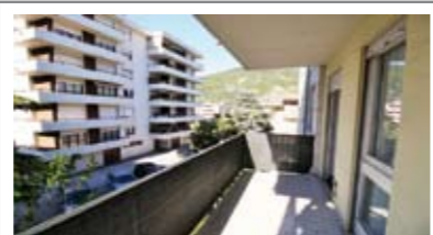
A027: TRENTO NORD: BEL MINIAPPARTAMENTO fuori dal traffico, IN ESCLUSIVA, ingresso, soggiorno/cucina con uscita sull'ampio balcone, stanza matrimoniale, bagno f., cantina, Cl. En. D