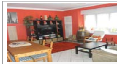
C141: V. MILANO: Appartamento ristrutturato da 97 mq., interno al traffico, ingresso, soggiorno, cucina, disbrigo notte arredabile, stanza matrimoniale, 2 ampie singole, bagno f., balcone. P. auto, cantina e soffitta. Cl. En. N.D.