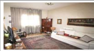
C061: ZONA S. CAMILLO: SIGNORILE 3 STANZE A PIANO ALTO a due passi dal centro, ampia metratura, luminoso e ben esposto, ingresso, soggiorno, balcone a sud, cucina abitabile, disbrigo, tre stanze matrimoniali, bagno f., ripostiglio, cantina., Cl. En. E