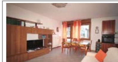
B070: CRISTO RE: OCCASIONE RIAMMODERNATO fuori dal traffico, vicino ai servizi, a piano rialzato, ben esposto, ampio ingresso, grande soggiorno - pranzo, comodo angolo cucina, ripostiglio, disimpegno notte, bagno f., 2 matrimoniali, cantina, p. auto cond. garantito, Cl. En. E