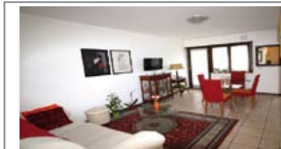
A080: LIMITROFO "ALBERE": OTTIMO MINIAPPARTAMENTO pari al NUOVO, zona servitissima, ingresso, soggiorno - cucina con uscita su balcone, bagno, camera matrimoniale con uscita su secondo balcone, cantina, Cl. En. C