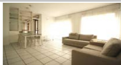
A096: CERNIDOR: Raffinato MINIAPPARTAMENTO con grande giardino, 60 mq. netti, ingresso, ampia zona living da 30 mq., cucina abitabile, stanza matrimoniale, bagno, anti-bagno ripostiglio/lavanderia, cantina, T.A., (mobili di design) Cl. En. N.D.