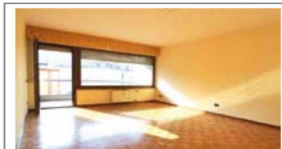
B020: LUNGO FERSINA: AMPIO PIANO ALTO SUD-OVEST, in condominio tranquillo e ottimamente curato, ottimamente esposto, ingresso arredabile, soggiorno con ampio balcone, cucina abitabile separata, disimpegno notte, 2 matrimoniali, bagno f., cantina e posto auto privato, Cl. En. C