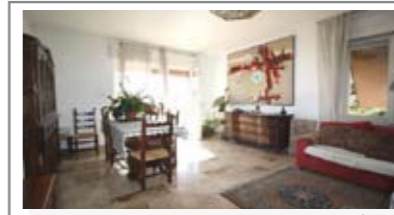
C058: ZONA S. PIO X: RARO 3 STANZE da 154 mq. con TERRAZZA a sud-ovest In palazzina residenziale con bel giardino. Ingr. ampiamente arredabile, cucina abitabile con dispensa/ripostiglio, ampio soggiorno, terrazza panoramica, 3 st. matrimoniali, doppi servizi, balcone. Cantina, soffitta, Cl. En. N.D.