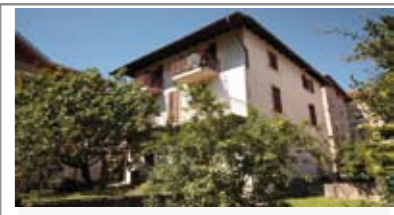
G011: ALDENO: VILLA BIFAMILIARE CON 600 mq. GIARDINO, posizione centrale, 2 depositi/avvolti, locali tecnici, 2 analoghe unità indipendenti costituite da ingr., cucina con balcone, ripostiglio, bagno f., 2 matrimoniali, stanza/salotto, balcone, soffitta, garage di oltre 120 mq., T.A., Cl. En. G