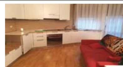
A061: LIMITROFO CENTRO STORICO: MINIAPPARTAMENTO A NUOVO e ARREDATO, in posizione strategica, arredato, III piano con ascensore, ingr., soggiorno/cucina, bagno f., st. matrimoniale, balcone. Immobile a reddito - buon investimento! Cl. En. C