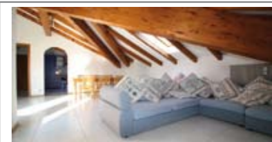
B083: S. PIO X: SPLENDIDA MANSARDA da 140 mq., a terzo piano con ascensore, ingresso, soggiorno/cucina, terrazza a vasca, ripostiglio, stanza singola, ampio bagno f., grande matrimoniale, cantina, (possibilità di posto auto), T.A., Cl. En. E,