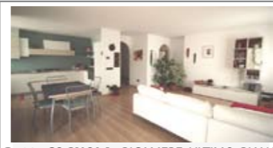
B102: COGNOLA: BICAMERE ULTIMO PIANO RISTRUTTURATO NEL 2007, vicino a tutti i servizi, in posizione soleggiata e con vista, ingresso, ampia zona giorno con angolo cottura e confortevole zona soggiorno, balcone ad ovest, disbrigo notte, 2 ampie matrimoniali, bagno f., ampia soffitta f., garage, T.A., Cl. En. D