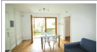
A043: MARTIGNANO: RECENTE MINIAPPARTAMENTO CON GIARDINO, in palazzina del 2016, ingresso, soggiorno/cucina con accesso al giardino, stanza matrimoniale e bagno f. Possibilità di garage con annessa cantina, T.A., Cl. En. A+