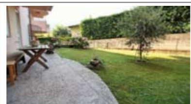
B033: MATTARELLO: OTTIMO 2 STANZE CON AMPIO GIARDINO, in contesto residenziale adiacente al centro di Mattarello, zona giorno con cottura a vista e sfogo sul giardino, disbrigo notte arredabile, stanza matrimoniale, stanza doppia, bagno f., cantina e garage, T.A., Cl. En. N.D.