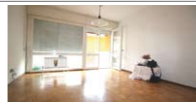
B056: BOLGHERA: PRIMISSIME VICINANZE OSPEDALE, in un contesto tranquillo, a secondo piano, ingresso, cucina, soggiorno, bel terrazzino abitabile, camera matrimoniale, camera doppia, ampio bagno, Cl. En. D