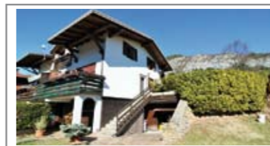
H018: CIMIRLO: SPLENDIDA BIFAMILIARE verticale libera su tre lati con giardino di circa 300 mq. L'immobile è suddiviso in 2 appartamenti uno con ampia terrazza. Gli appartamenti sono collegabili in modo da creare un'unica unità giorno/notte di circa 150 mq. oltre a stube e ampio garage, T.A., Cl. En. DE