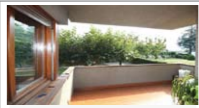
C018: POVO: IN QUADRIFAMILIARE ottimo appartamento di ben 107 mq. utili, ottimamente esposto e con vista. Ingr., soggiorno di 30 mq., terrazza, cucina abitabile, ripost., doppi servizi, disimp. arredabile, matrimoniale 18 mq., balcone, stanza doppia, (ricavabile terza stanza); box, cantina, orto e giardino, T.A., Cl. En. E