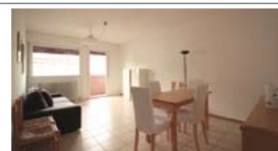
B028: CRISTO RE: ULTIMO PIANO CON ASCENSORE - RISTRUTTURATO, luminoso e panoramico, ingresso, cucinino e ampia zona soggiorno/pranzo con ampio balcone a SUD, disbrigo notte arredabile, ripost., bagno, 2 ampie matrimoniali, soffitta, p. auto privato, Cl. En. D