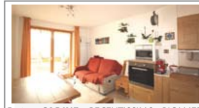
B104: CADINE: RECENTISSIMO BICAMERE COME NUOVO, a piano intermedio, luminoso e con vista; ingr., zona giorno - cottura con terrazza ad ovest, disimpegno arredabile, stanza matrimoniale con secondo balcone, stanza singola, bagno. Cantina, Box doppio da 33 mq., p. auto privato. T.A., Cl. En. C+