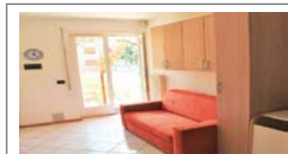
A007: BESENELLO: MINIAPPARTAMENTO del 2002 con GIARDINO 60 mq. a SUD in piccola palazzina, ottime condizioni, ingr., soggiorno-cucina, disbrigo, stanza matrimoniale, bagno, balcone, ripostiglio, garage 18 mq., imp. allarme, T.A., Cl. En. D