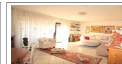
C015: COGNOLA: SECONDO E ULTIMO PIANO PANORAMICO - RISTR. 2005, vicino a tutti i servizi, luminosissimo, ingr. arredabile, rara zona giorno da oltre 40 mq., balconi panoramici, scala di dislivello, 2 matrimoniali, balcone, stanza singola, ripost., doppi servizi, doppi servizi. Cantina e garage, T.A., Cl. En. E