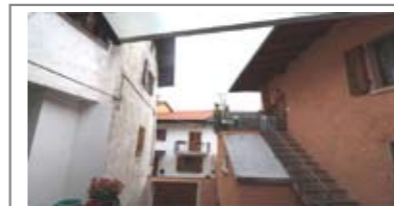
B052: VILLAMONTAGNA: PORZIONCINA INDIPENDENTE, in centro storico, a piano terra 2 ampi avvolti ad uso deposito/cantina con w.c., a primo piano, ballatoio, ingr., soggiorno con angolo cucina, 1° stanza, ampio bagno, disimpegno notte, 2 stanze letto e guardaroba. Possibilità di garage, Cl. En. N.D.