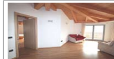
C074: VILLAMONTAGNA: ATTICO PANORAMICO PARI AL NUOVO, IN PICCOLA RECENTE PALAZZINA, completamente sbarriata, ingresso, ampia zona giorno, balconi panoramici, cucina abitabile, disbrigo notte, doppi servizi, tre stanze, garage doppio e cantina, T.A., Cl. En. B