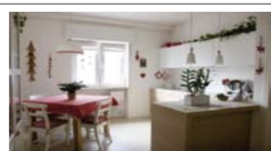
A023: VIA PERINI: SPLENDIDO MINIAPPARTAMENTO ULTIMO PIANO, in piccola palazzina, completamente ristrutturato e ammobiliato a nuovo, zona soggiorno con cucina a vista, terrazza, ampia camera matrimoniale, disbrigo, ampio bagno f., soffitta, Cl. En. C+