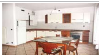
B012: SOPRAMONTE: ABITABILISSIMO, in piccola e recente palazzina, ottimo appartamento composto da ingresso, soggiorno-cucina, terrazzino ad ovest con vista libera, disbrigo, stanza matrimoniale, stanza singola, bagno. Garage doppio in lunghezza e p. auto cond., T.A., Cl. En. E