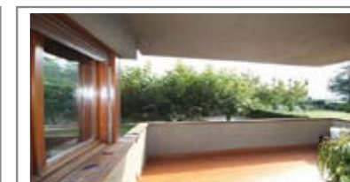
C018: POVO: IN QUADRIFAMILIARE ottimo appartamento di ben 107 mq. utili, ottimamente esposto e con vista. Ingr., soggiorno di 30 mq., terrazza, cucina abitabile, ripost., doppi servizi, disimp. arredabile, matrimoniale 18 mq., balcone, stanza doppia, (ricavabile terza stanza); box, cantina, orto e giardino, T.A., Cl. En. E