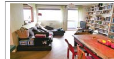
B060: CRISTO RE: ESPOSIZIONE SUD A PIANO ALTO, a 5 min. a piedi dal centro, ingresso, cucina, ampio soggiorno, balcone a sud, bagno e due ampie camere matrimoniali una con cabina armadio, soffitta e p. auto privato, Cl. En. E