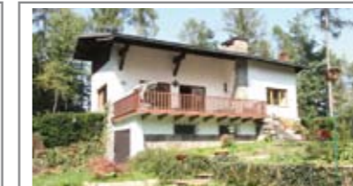
G027: TENNA: VILLA SINGOLA con 1000 mq. di giardino recintato, accesso da terrazza di oltre 30 mq. a sud, ampio soggiorno, cucina, balcone, bagno f., 2 stanze; in mansarda: bagno f., 2 stanze e ampia zona living. Box e Stube, T.A., Cl. En. E