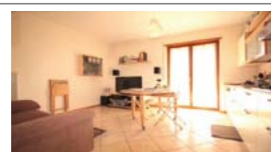
A061: VILLAMONTAGNA: MINIAPPARTAMENTO con Terrazzo, in piccola e recente palazzina, luminosissimo, ingresso, soggiorno/cucina, terrazza, corridoio, bagno, camera matrimoniale, giardinetto e cantina, T.A., Cl. En. D