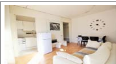
A031: CRISTO RE: OTTIMA SOLUZIONE PER INVESTIMENTO! ADIACENTE AL centro, comodissimo alla stazione, appartamento riammodernato, totalmente arredato e ben esposto, ingresso, soggiorno con angolo cucina, stanza matrimoniale, bagno e terrazza da 50 mq., Cl. En. D