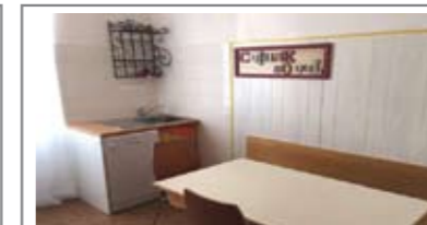
B058: LATERALE V. PERINI: OTTIMO INVESTIMENTO AD ULTIMO PIANO, in contesto tranquillo e riservato, ingresso, soggiorno, cucina, 2 stanze, cantina e p. auto cond., T.A., Cl. En. E