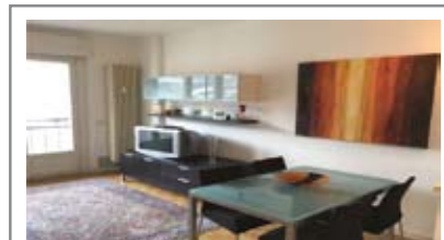
A044: CERVARA: ULTIMO PIANO PANORAMICO, ristrutturato, miniappartamento da 60 mq., ingresso con atrio arredabile, cucina - soggiorno, grande balcone con vista, camera matrimoniale, bagno f., ripostiglio. Garage e cantina, Cl. En. N.D.