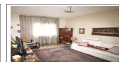
C061: ZONA S. CAMILLO: SIGNORILE 3 STANZE A PIANO ALTO a due passi dal centro, ampia metratura, luminoso e ben esposto, ingresso, soggiorno, balcone a sud, cucina abitabile, disbrigo, tre stanze matrimoniali, bagno f., ripostiglio, cantina., Cl. En. E