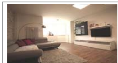
B030: SOLTERI: AMPIO 2 STANZE RISTRUTTURATO nel 2015, ottimamente esposto, luminosissimo, atrio d'ingresso arredabile, soggiorno/cucina di 45 mq. a sud-ovest, disbrigo, camera matrimoniale, camera doppia, ripostiglio e bagno. Garage e cantina, T.A., Cl. En. D