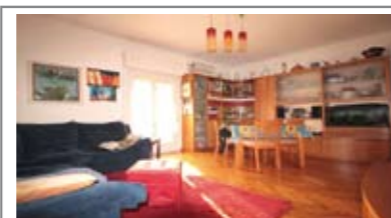
B040: OSPEDALE S. CHIARA: ULTIMO PIANO PANORAMICO ristrutturato nel 1999, ingresso, ampio soggiorno, balcone abitabile a sud, zona pranzo/cucinino, ampio bagno f., 2 ampie matrimoniali, cantina e p. auto cond. a rotazione. ** SPLENDIDA VISTA **, Cl. En. E