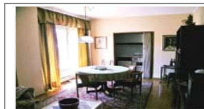
B005: BOLGHERA: ULTIMO PIANO VISTA PANORAMICA, bicamere con ampio terrazzino, zona giorno con cucinino separato, camera matrimoniale, camera singola, bagno f., ripostiglio, cantina, Cl. En. D