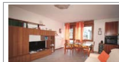
B070: CRISTO RE: OCCASIONE RIAMMODERNATO fuori dal traffico, vicino ai servizi, a piano rialzato, ben esposto, ampio ingresso, grande soggiorno - pranzo, comodo angolo cucina, ripostiglio, disimpegno notte, bagno f., 2 matrimoniali, cantina, p. auto cond. garantito, Cl. En. E