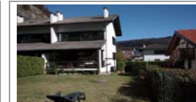
H035: CADINE: PORZIONE BIFAMILIARE CON 400 mq. GIARDINO in posizione dominante, ottimamente esposta, ampio soggiorno con terrazza a sud con accesso al favoloso giardino, cucina abitabile, doppi servizi, zona notte con ampia matrimoniale, stanza doppia e ampia stanza singola. Openspace mansardato con w.c., cantina, lavanderia, garage, Cl. En. N.D.