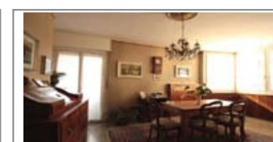
C065: ZONA V. MILANO: CENTRALISSIMO e SIGNORILE 3 STANZE: grande appartamento in condominio interamente manutentato, ingresso, cucina abitabile, ampio e luminoso soggiorno con balcone a sud/ovest; disbrigo notte, 2 grandi matrimoniali, balcone, stanza doppia, doppi servizi, ripostiglio, Cl. En. E