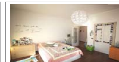
C054: LIMITROFO CENTRO: OCCASIONE, ampia soluzione tricamere da 133 mq., abitabile da subito: ingr., corridoio, grande soggiorno/cucina, 3 ampie matrimoniali, 2 bagni f., cantina e due posti auto in cortile privato, T.A., Cl. En. E