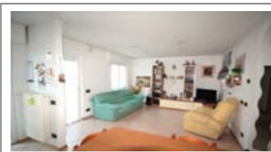
B001: S. PIO X: AMPIO 2 STANZE AD ULTIMO PIANO, ben esposto e luminoso, in piccola palazzina, recentemente ristrutturato, ingresso, soggiorno/cucina con balcone a ovest, disbrigo notte, ripostiglio, stanza matrimoniale, stanza doppia, secondo balcone, bagno f., cantina, soffitta, p. auto cond., T.A., Cl. En. E