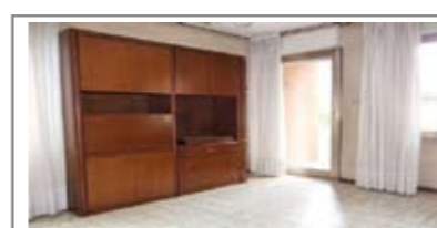
C057: RAVINA: AMPIO 3 STANZE in palazzina di 2 piani, ampia soluzione: ingresso, cucina abitabile, soggiorno, balcone, ripostiglio, bagno finestrato, due matrimoniali e una doppia. Cantina e garage compresi nel prezzo! Possibilità di ulteriore cantina, posto auto e soffitta, T.A., Cl. En. E