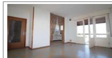
C040: S. PIO X - ZONA N.O.T.: AMPIO ULTIMO ED INTERO PIANO ampia soluzione, ingresso arredabile, sala giorno con balcone, sala pranzo con altro balcone, cucinino con dispensa, stanza bagno, 3 matrimoniali, p. auto in cortile privato, cantina e garage., Cl. En. D