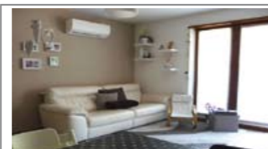
B015: MEANO: RECENTISSIMO E CON OGNI COMFORT, In graziosa palazzina, soluzione bicamere praticamente pari al nuovo: soggiorno/cucina, balcone, disimpegno notte arredabile, stanza doppia, stanza matrimoniale e bagno f., p. auto di proprietà, T.A., Cl. En. B