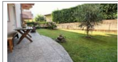
B033: MATTARELLO: OTTIMO 2 STANZE CON AMPIO GIARDINO, in contesto residenziale adiacente al centro di Mattarello, zona giorno con cottura a vista e sfogo sul giardino, disbrigo notte arredabile, stanza matrimoniale, stanza doppia, bagno f., cantina e garage, T.A., Cl. En. N.D. € 230.000