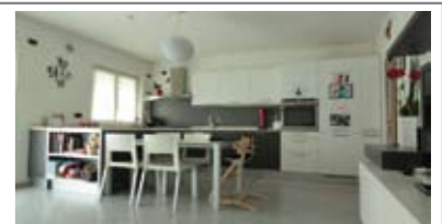
B086: RONCAFORT: RECENTISSIMO CASA-CLIMA "A", ampio bicamere con giardino/lavatoio a circondare i tre lati; ingr., soggiorno con zona pranzo e cucina, ampio disimpegno arredabile, doppi servizi, stanza matrimoniale, stanza doppia, garage, Cl. En. A € 235.000