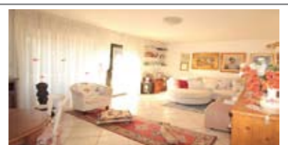
C015: COGNOLA: SECONDO E ULTIMO PIANO PANORAMICO - RISTR. 2005, vicino a tutti i servizi, luminosissimo, ingr. arredabile, rara zona giorno da oltre 40 mq., balconi panoramici, scala di dislivello, 2 matrimoniali, balcone, stanza singola, ripost., doppi servizi. Cantina e garage, T.A., Cl. En. E € 315.000