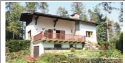
G027: TENNA: VILLA SINGOLA con 1000 mq. di giardino recintato, accesso da terrazza di oltre 30 mq. a sud, ampio soggiorno, cucina, balcone, bagno f., 2 stanze; in mansarda: bagno f., 2 stanze e ampia zona living. Box e Stube, T.A., Cl. En. E € 359.000