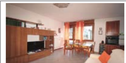
B070: CRISTO RE: OCCASIONE RIAMMODERNATO fuori dal traffico, vicino ai servizi, a piano rialzato, ben esposto, ampio ingresso, grande soggiorno - pranzo, comodo angolo cucina, ripostiglio, disimpegno notte, bagno f., 2 matrimoniali, cantina, p. auto cond. garantito, Cl. En. E € 179.000