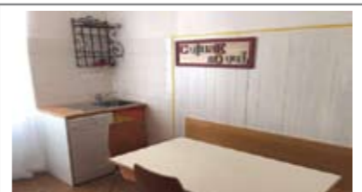
B058: LATERALE V. PERINI: OTTIMO INVESTIMENTO AD ULTIMO PIANO, in contesto tranquillo e riservato, ingresso, soggiorno, cucina, 2 stanze, cantina e p. auto cond., T.A., Cl. En. E € 140.000