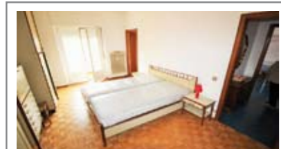
A075: ZONA UNIVERSITA': MINIAPPARTAMENTO a piano ALTO, in ottima palazzina servita da ascensore, ampia metratura, ingresso, soggiorno con cucinino a vista, ampia camera matrimoniale, bagno ristrutturato finestrato, balcone, soffitta, p. auto cond.. Ottimo investimento! Cl. En. D € 170.000