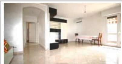
B029: CLARINA: PIANO ALTO CON ASCENSORE - RISTRUTTURATO nel 2016, molto luminoso, cucina/soggiorno, balcone, disbrigo zona notte, bagno, stanza matrimoniale, stanza studio, cantina e p. auto condominiali, Cl. En. N.D. € 230.000