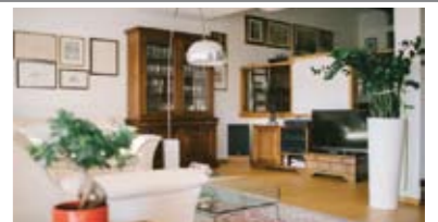
H098: SAN ROCCO: SCHIERA FINEMENTE RISTRUTTURATA NEL 2010, ingr., cucina, sala da pranzo, soggiorno, bagno, terrazzo con vista, giardino, disimp., bagno f., 2 matrimoniali, 1 stanza media, 2 terrazze, mansarda openspace, cantina, stube, loc. caldaia, lavanderia, T.A., garage, Cl. En. D € 430.000