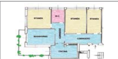
C097: V. GRAZIOLI: Luminoso APPARTAMENTO/UFFICIO 130 mq., in zona servitissima, a due passi dal centro e dal tribunale, a 1mo piano, ampio ingr. arredabile, soggiorno con ampio balcone, cucina, stanza doppia, stanza matrimoniale, stanza media, bagno f., cantina. (Attualmente A/10 trasformabile in A/2), Cl. En. D € 280.000