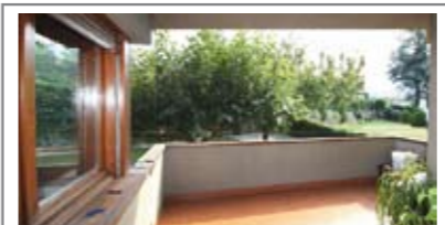
C018: POVO: IN QUADRIFAMILIARE ottimo appartamento di ben 107 mq. utili, ottimamente esposto e con vista. Ingr., soggiorno di 30 mq., terrazza, cucina abitabile, ripost., doppi servizi, disimp. arredabile, matrimoniale 18 mq., balcone, stanza doppia, (ricavabile terza stanza); box, cantina, orto e giardino, T.A., Cl. En. E € 290.000