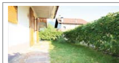
A007: MIOLA: RECENTISSIMO MINI CON GIARDINO E PERTINENZE, esposto su tre lati in zona tranquilla e soleggiata, soggiorno cucina open space, stanza matrimoniale, bagno f., disbrigo, ripostiglio, cantina, box da 24 mq., p. auto assegnato, T.A., Cl. En. D € 135.000