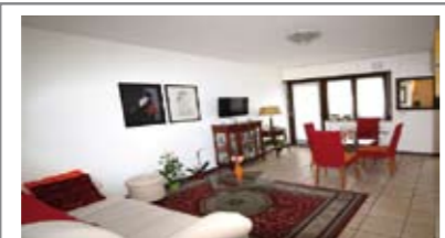
A080: LIMITROFO "ALBERE": MINIAPPARTAMENTO pari al NUOVO, zona servitissima, ingresso, soggiorno - cucina con uscita su balcone, bagno, camera matrimoniale con uscita su secondo balcone, cantina, Cl. En. C € 165.000 + ev. garage