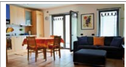
B036: CLARINA: PIANO TERRA CON 135 MQ. GIARDINO, in recente contesto residenziale, zona giorno con ingresso arredabile, cottura a vista e zona living, grande disbrigo, 2 stanze matrimoniali, bagno f, ripostiglio, cantina, ampio garage nell'interato e p. auto assegnato, Cl. En. C € 270.000