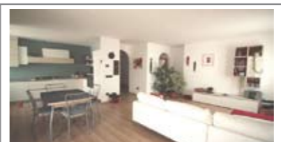
B102: COGNOLA: BICAMERE ULTIMO PIANO RISTRUTTURATO NEL 2007, vicino a tutti i servizi, in posizione soleggiata e con vista, ingresso, ampia zona giorno con angolo cottura e confortevole zona soggiorno, balcone ad ovest, disbrigo notte, 2 ampie matrimoniali, bagno f., ampia soffitta f., garage, T.A., Cl. En. D € 255.000