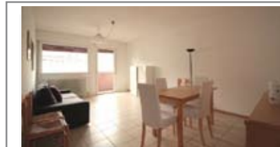
B028: CRISTO RE: ULTIMO PIANO CON ASCENSORE - RISTRUTTURATO, luminoso e panoramico, ingresso, cucinino e ampia zona soggiorno/pranzo con ampio balcone a SUD, disbrigo notte arredabile, ripost., bagno, 2 ampie matrimoniali, soffitta, p. auto privato, Cl. En. D € 200.000