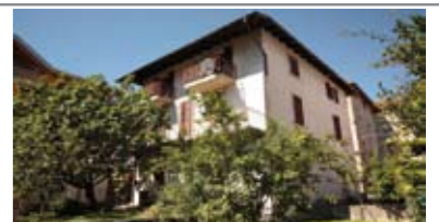
G011: ALDENO: VILLA BIFAMILIARE CON 600 mq. GIARDINO, posizione centrale, 2 depositi/avvolti, locali tecnici, 2 analoghe unità indipendenti costituite da ingr., cucina con balcone, ripostiglio, bagno f., 2 matrimoniali, stanza/salotto, balcone, soffitta, garage di oltre 120 mq., T.A., Cl. En. G € 410.000