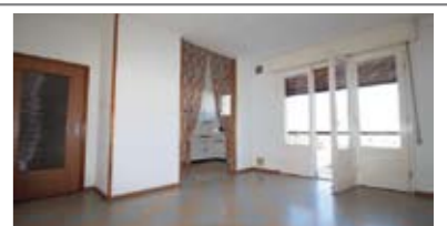
C040: S. PIO X - ZONA N.O.T.: AMPIO ULTIMO ED INTERO PIANO ampia soluzione, ingresso arredabile, sala giorno con balcone, sala pranzo con atrio balcone, cucinino con dispensa, stanza bagno, 3 matrimoniali, p. auto in cortile privato, cantina e garage., Cl. En. D € 160.000