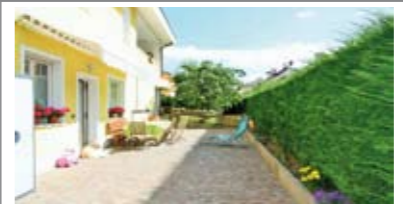
G029: MEANO: VILLA BIFAMILIARE con ampio giardino composta da 2 ampi appartamenti indip., bicamere con doppi servizi, ampio garage. (Caldaie a condensazione, serramenti triplo vetro, tapparelle elettriche, risc. pavimento, cappotto, v.citofono, pred. allarme). Ideale per famiglia con 2 nuclei, T.A., Cl. En. C € 630.000