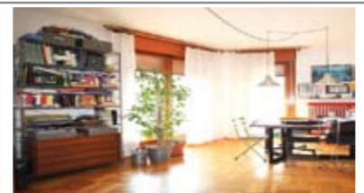
B031: BOLGHERA: PIANO RIALZATO - ABITABILISSIMO, in palazzina tranquilla, a due passi dall'ospedale, ampio soggiorno con cucinino separato, balcone, bagno f., ripostiglio, 2 camere matrimoniali, ampia cantina, Cl. En. N.D. € 250.000