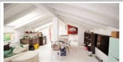
B075: ISCHIA: VISTA LAGO, SPLENDIDO RISTRUTTURATO duplex con ottime finiture, ingr. indip., atrio arredabile, stanza medio/singola, stanza matrimoniale con ripostiglio/cabina armadio, bagno f., al piano mansardato alto zona giorno openspace con cucina a vista, secondo bagno f., garage. Possibilità di arredo, T.A., Cl. En. C € 259.500