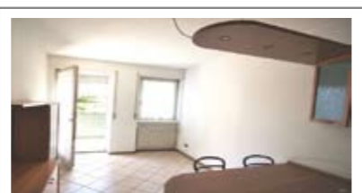
A027: TRENTO NORD: BEL MINIAPPARTAMENTO A fuori dal traffico, IN ESCLUSIVA, ingresso, soggiorno/cucina con uscita sull'ampio balcone, stanza matrimoniale, bagno f., cantina, Cl. En. D € 103.000 + ev. garage