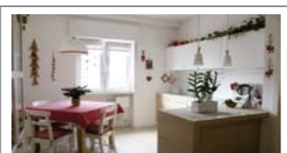
A023: VIA PERINI: SPLENDIDO MINIAPPARTAMENTO ULTIMO PIANO, in piccola palazzina, completamente ristrutturato e ammobiliato a nuovo, zona soggiorno con cucina a vista, terrazza, ampia camera matrimoniale, disbrigo, ampio bagno f., soffitta, Cl. En. C+ € 180.000